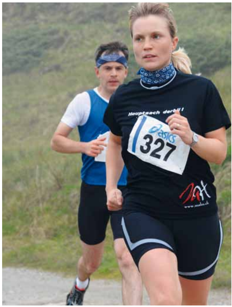
«Hauptsach debii»: Das Motto auf dem T-Shirt dieser Teilnehmerin entspricht dem Erlebnischarakter des Gantrisch Marathons.