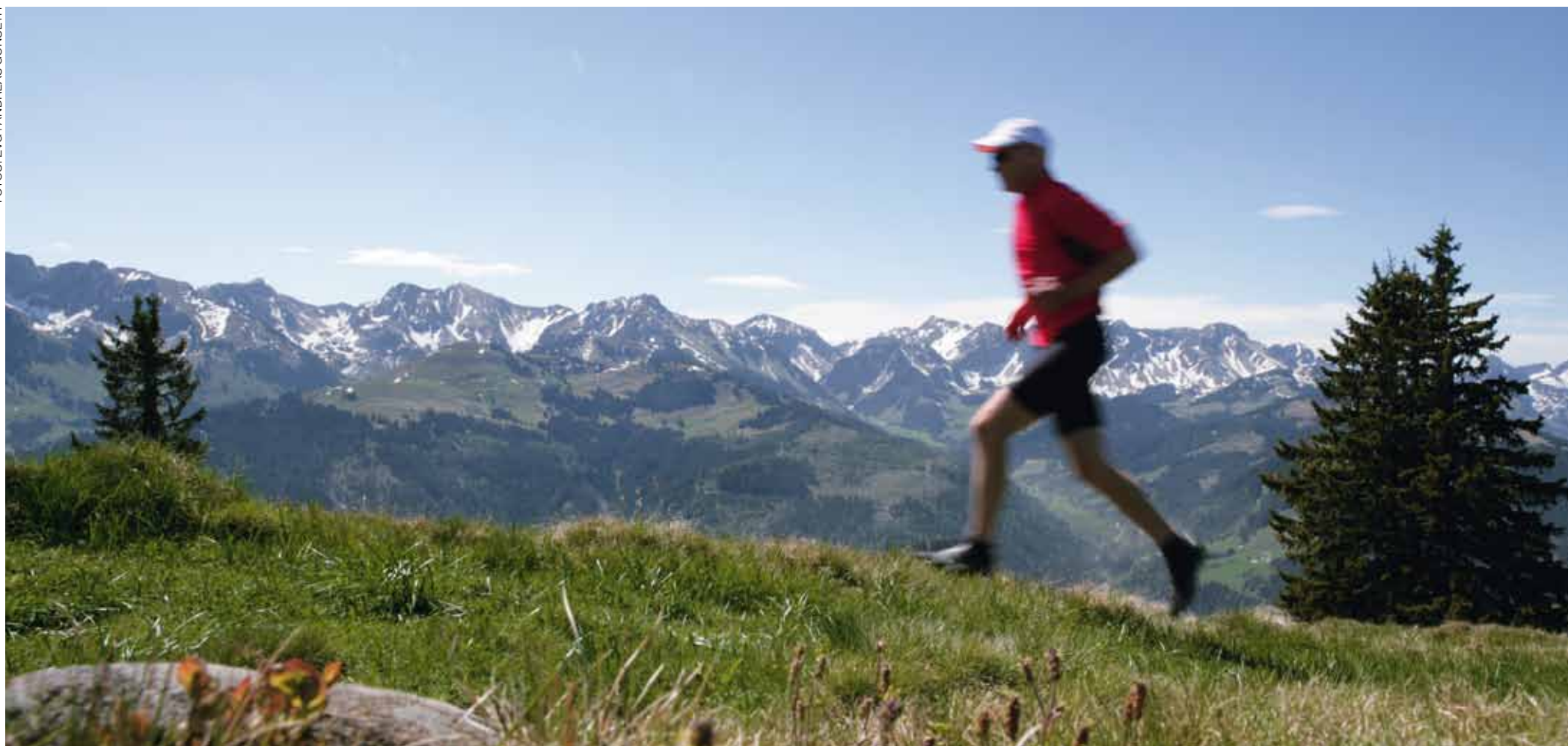
Der Gantrisch Panoramaweg bietet auf beide Seiten einen fantastischen Weitblick: Links Richtung Jura über das ganze Schwarzenburgerland, rechts (im Bild) Richtung Simmental mit den Gipfeln Schibe, Märe und Schafarnisch.