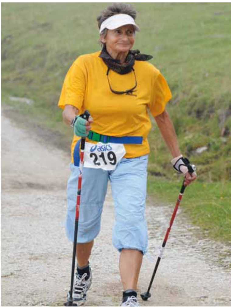
Auch Nordic Walker(innen) können die landschaftlichen Reize der Strecke in vollen Zügen geniessen.

Schafarnisch, Märe, Widdersgrind und der Ochsen. Echte Stiere, Ochsen oder Widder trifft der Läufer jetzt keine mehr an, dafür andere, mystische Wesen. Glaubt man den Erzählungen, wohnen einige Elfen, Feen und Zwerge unter dem Pfyffengrat, dem die Halbmarathonstrecke nun folgt.